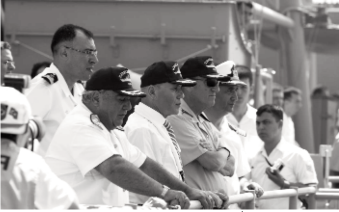
Cumhurbaşkanı Mehmetali Talat Tatbikati İzledi: